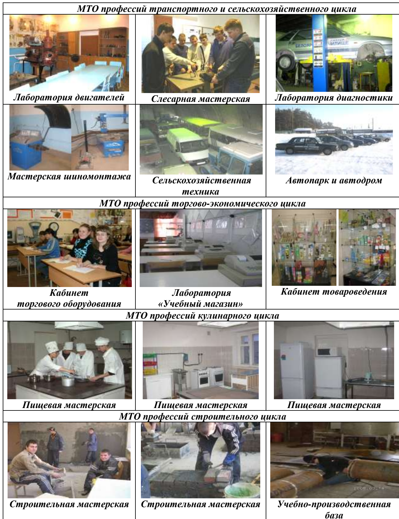
Рисунок 5 – Материально-техническое оснащение образовательного процесса в БМТ

– компьютерные классы – 5, количество ПК – 61