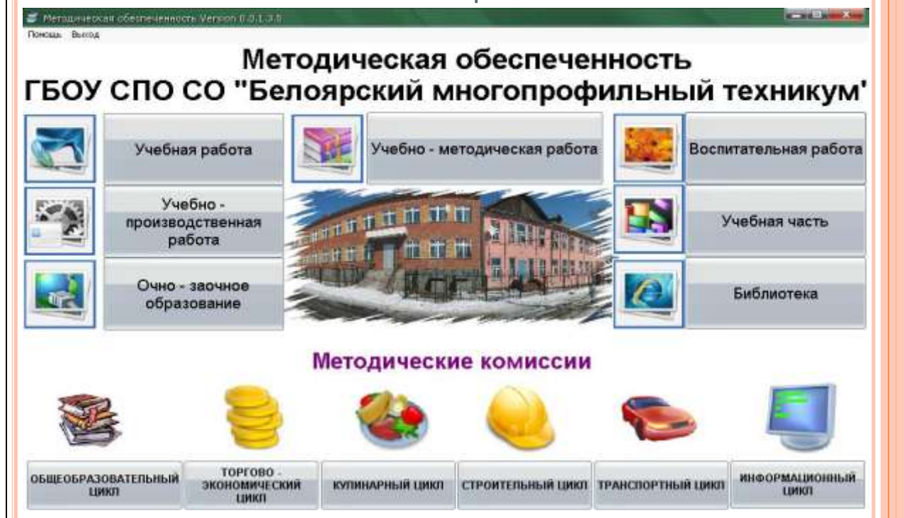
Рисунок 4 – Программный сетевой модуль «Методическая обеспеченность образовательного процесса»

Техническое оснащение (проекторы, множительная и копировальная техника, локальная сеть) позволяет успешно использовать новые формы и способы доставки учебного материала, дополнительные иллюстративные возможности средств мультимедиа. Преподавателями используются мультимедийные лекции, компьютерные презентации, иное программное обеспечение учебного назначения. ОУ подключено к Интернет.